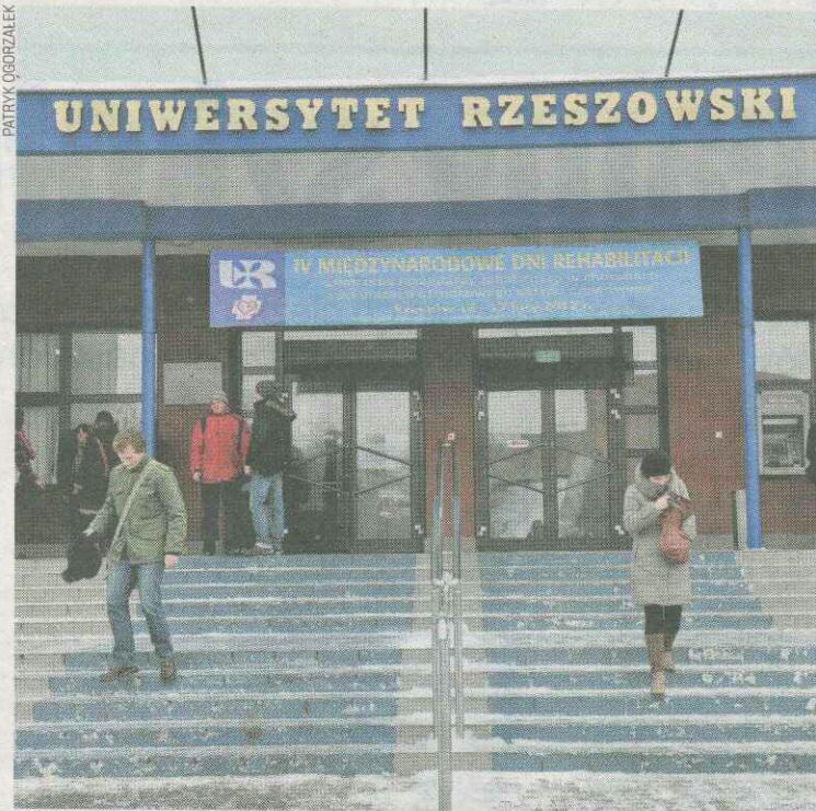
Najważniejsza uczelnia Podkarpacia

uczyć się wykorzystywać nowoczesne technologie do zawodowego funkcjonowania w sieci - od profesjonalnej działalności w mediach poprzez komunikację w mediach społecznościowych do kreowania wizerunku osób, firm, instytucji i idei. Zajęcia, niemal wyłącznie praktyczne, poprowadzą specjaliści zajmujący się internetem. Do nauki będą służyć nowoczesne, specjalistyczne laboratoria - fotograficzne, radiowe, telewizyjne i graficzne. W programie studiów są m.in.: webwriting i redagowanie tekstów, warsztaty wideo, radio online z obróbką dźwięku, pracownia fotografii cyfrowej, komunikacja wizerunkowa, komunikowanie w mediach społecznościowych, kampanie marketingowe w mediach społecznościowych oraz social media dla dziennikarzy; • psychologia w zarządzaniu - kierunek łączący elementy psychologii i zarządzania. W programie studiów m.in.: coaching w biznesie, zarządzanie kompetencjami pracowników,