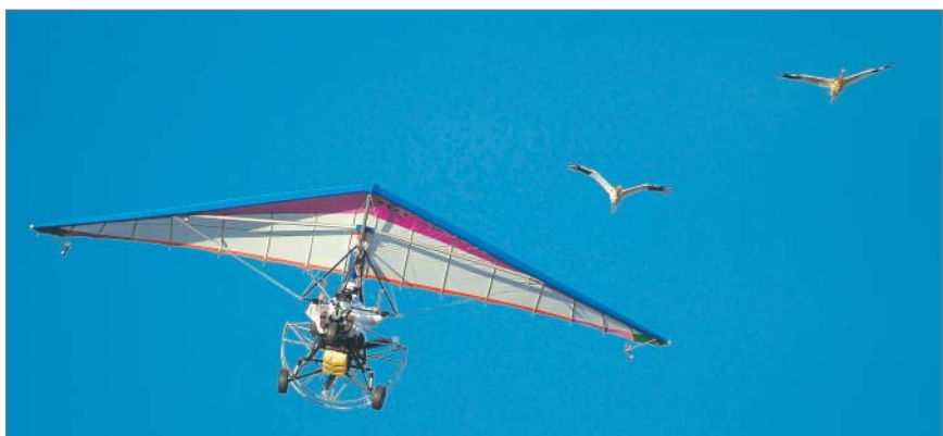
■ Prezydent Rosji znakomicie uczy żurawie trudnej sztuki latania

Autor jest rosoznawcą i historykiem idei, profesorem IJ, rektorem PWSZ im. Stanisława Piłgonia w Krośnie. Opublikował m.in. „Od Czaadajewa do Bierdajewa. Spór o Boga i człowieka w myśli rosyjskiej 1832–1922” (1988), „Większa Europa. Papież wobec Rosji i Ukrainy” (2001), „Między Krakowem, Rzymem a Moskwą. Rosyjska idea w nowej Polsce” (Moskwa 2013, w jęz. ros.)