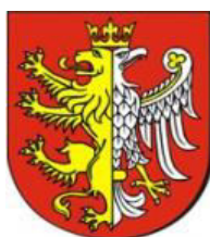
PREZYDENT MIASTA KROSNA